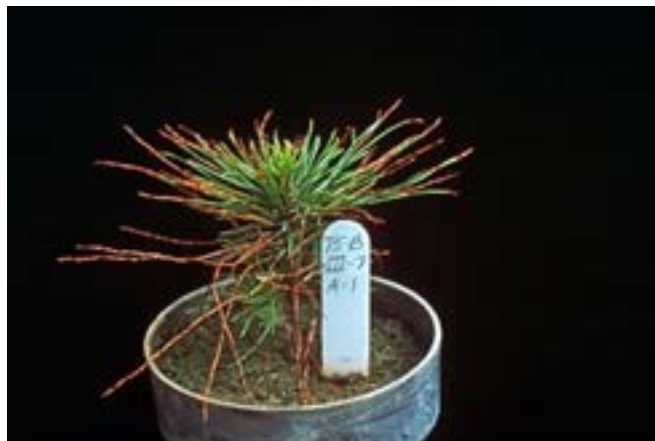
Поврежденный сеянец (МР ВНИИКР № 75-2014)

Ссылки на основные источники информации по выявлению и идентификации: