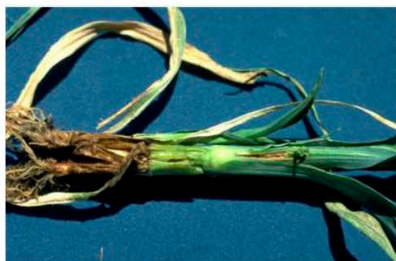
Язва на стебле гвоздики (GRISP, Antibes, FR)