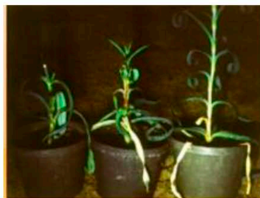
Симптомы на гвоздике при искусственном заражении (J. Nemeth, Plant Protection and Soil Conservation Service, Pecs, HU)