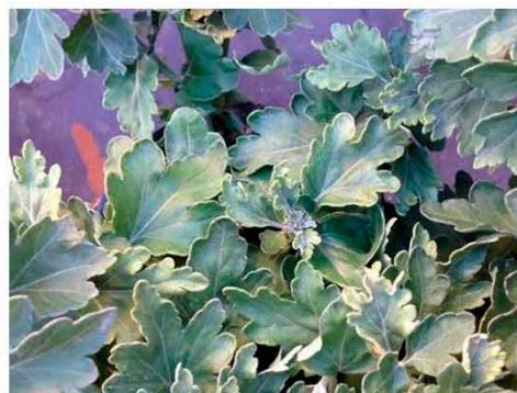
Различные симптомы заражения растений хризантемы вирусом некроза побегов хризантемы (EPPO-PQR, 2015)