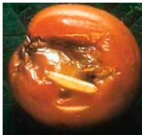
Плод вишни с личинкой R. cingulata