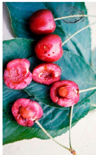
Плоды вишни с личинками R. cingulata