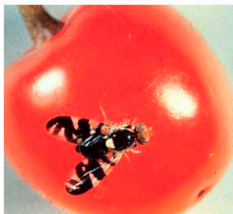
Имаго R. cingulata