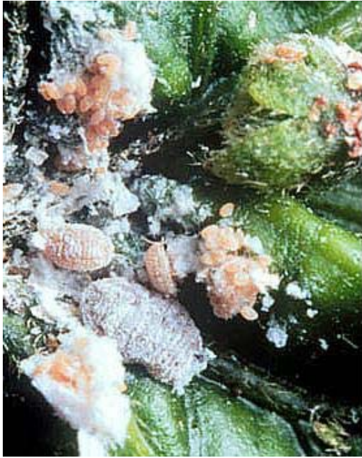
Колонии самок и личинок жестковолосого червеца ( www.plantdex.com , usda.gov )