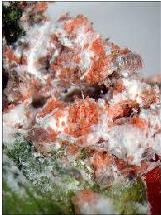
Яйцекладка жестковолосого червеца