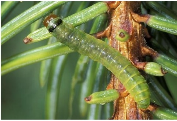
Гусеница Acleris gloverana