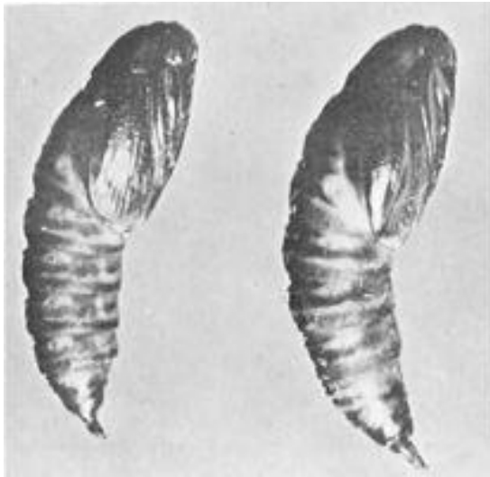
Куколка Acleris gloverana