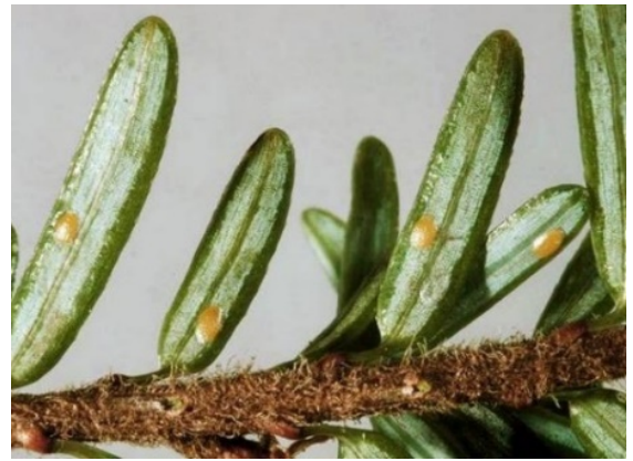
Яйца Acleris gloverana на хвоинках ( http://www.plantwise.org )