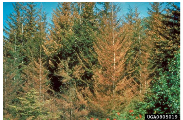
Поврежденные деревья