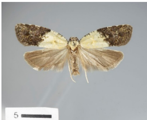
Имаго Acleris gloverana

Основным способом выявления черноголовой листовертки-почкоеда является тщательный визуальный осмотр. Основным способом диагностики вредителя является идентификация по морфологическим признакам (строение полового органа самца).