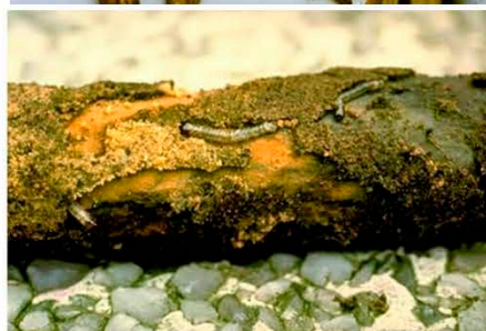
Повреждения стволиков и ветвей декоративных растений O. sacchari ( http://www.eppo.int ) ( http://www.eppo.int )