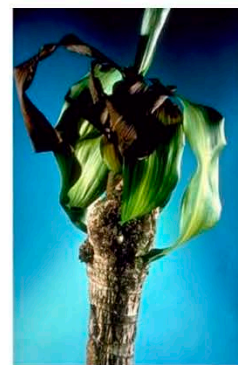
Растения, пораженные O. sacchari ( http://bugwoodcloud.org ) ( http://www.forestryimages.org )