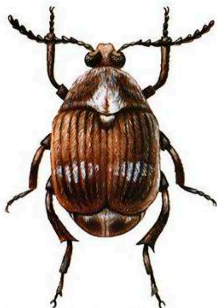
Имаго Zabrotes subfasciatus ( http://www.pesticity.ru/pest/zabrotes_subfasciatus )

Методы диагностики: визуальный досмотр, рентгенологический метод.