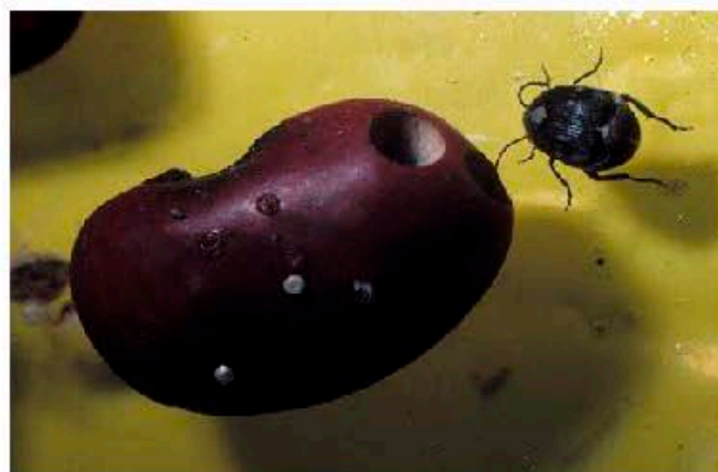
Повреждения фасоли бразильской бобовой зерновкой ( http://www.pesticity.ru/pest/zabrotes_subfasciatus )