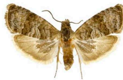
Имаго C. packardi (самец) (самец)

При поражении фруктов сквозь кожуру пораженных плодов вишни заметен узкий, коричневый ход, начинающийся от входного отверстия, расположенного обычно в центре темной, вдавленной площадки на поверхности плода. В случае поражения гусеницами яблок, под их кожей могут быть найдены мины с личинкой внутри.