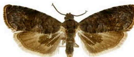
Имаго C. packardi ( http://idtools.org )