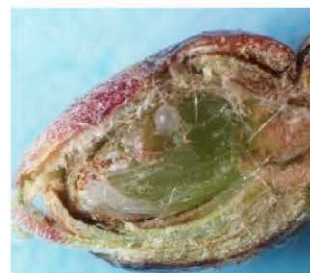
Яйцо D. kuriphilus в цветочной почке