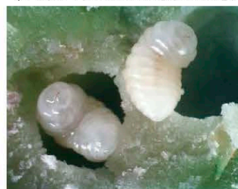
Личинки D. kuriphilus в цветочной почке