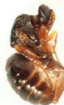
Куколка D. kuriphilus ( https://gd.eppo.int )