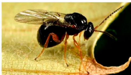
Восточная каштановая орехотворка ( D. kuriphilus ) ( http://wiki.bugwood.org )

Повреждает цветочные почки каштана настоящего, которые выглядят как аномальные разрастания тканей почки, листьев и стебля разной формы, размеров и окраски. Галлы с личинками внутри зеленые и красно-зеленые. После вылета самки галл чернеет. Галлы хорошо заметны на ветвях саженцев каштана посевного и других Castanea .