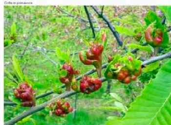
Галлы D. kuriphilus на листе каштана посевного ( http://www.regione.piemonte.it )