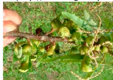
Галлы D. kuriphilus на листе каштана посевного