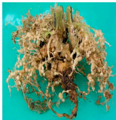
Meloidogyne enterolobii на корнях томата