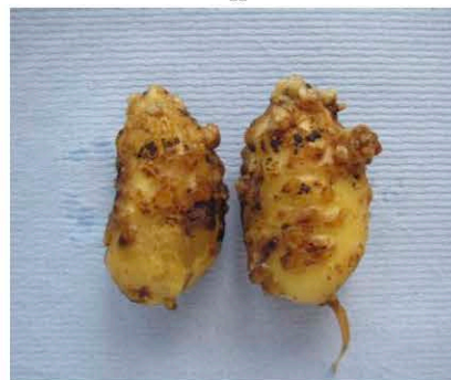
Meloidogyne enterolobii на клубнях картофеля

( http://pure.ilvo.vlaanderen.be/portal/files/2286106/Life_cycle_and_damage_caused_by_the_root_knot_nematode_Meloidogyne_minor_on_potato.Wesemael_et_al.pdf )