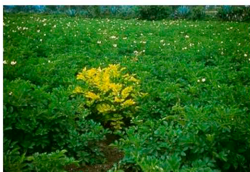
Растение картофеля сорта Maria, зараженное вирусом пожелтения жилок картофеля (PYVV)