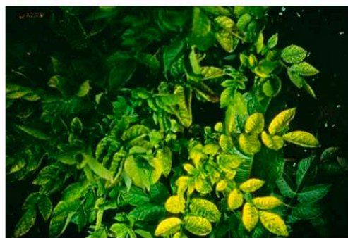
Симптомы вируса пожелтения жилок картофеля (PYVV) на листьях растения картофеля сорта Santa Catalina

Морщинистость, пожелтение жилок и пластинок листьев, клубни деформированные, с большими выступающими глазками.