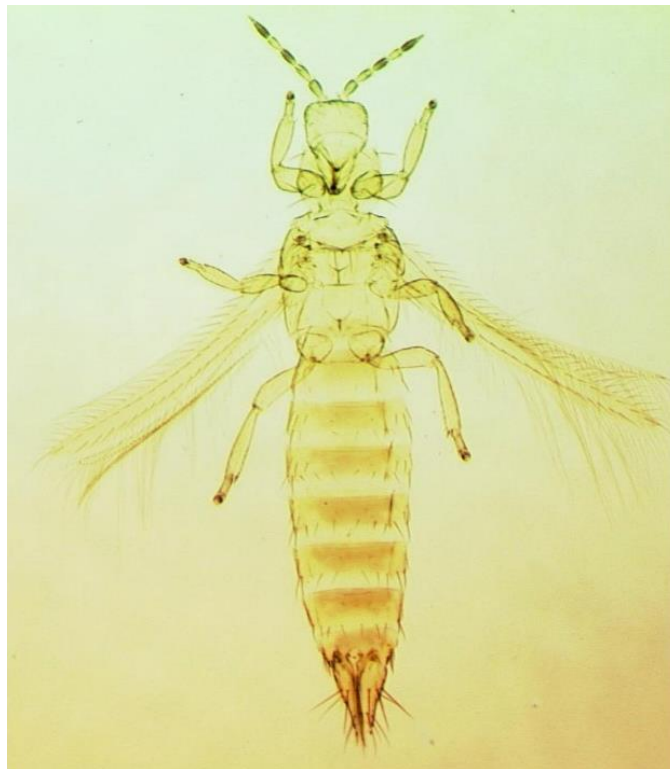
Рис. 2. Тотальный микропрепарат самки Frankliniella tritici ( http://keys.lucidcentral.org/keys/v3/thrips_of_california )