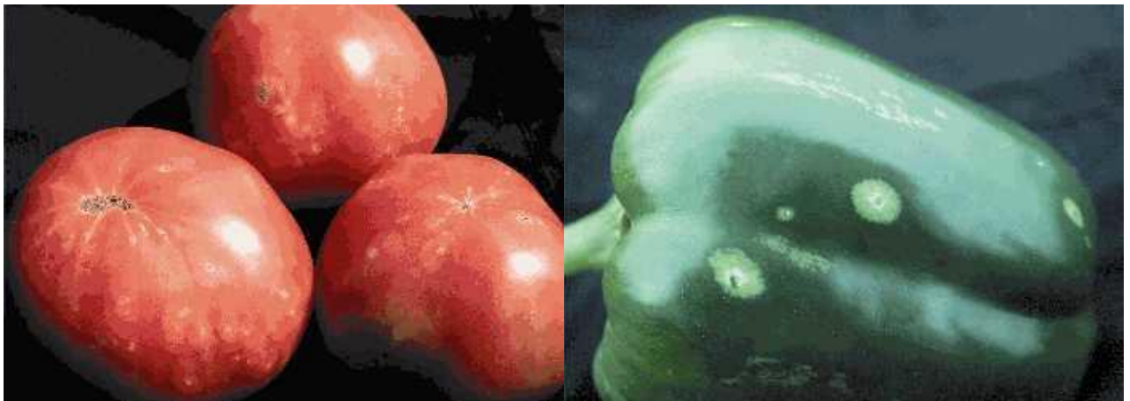
Рис. 1. Следы яйцекладок трипса на плодах томата (слева) и перца (справа) ( http://www.omafra.gov.on.ca/english/crops/facts/03-077.htm )

13. http://www.omafra.gov.on.ca/english/crops/facts/03-077.htm .