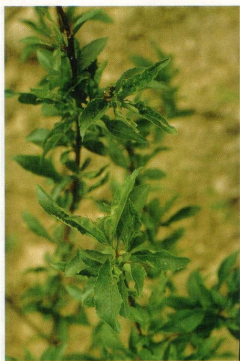
Симптомы на персике

1. МР ВНИИКР № 18-2014 Методические рекомендации по выявлению и идентификации неповируса розеточной мозаики персика Peach rosette mosaic nepovirus.