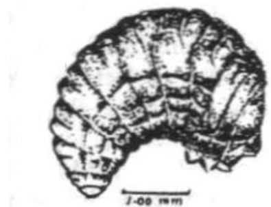
Личинка Callosobruchus maculatus