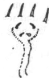
Эпифаринге личинки Callosobruchus analis