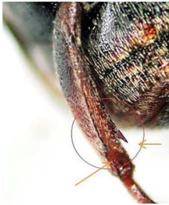
Заднее бедро зерновок рода Callosobruchus