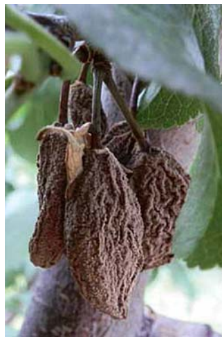
Мумифицированные плоды персика ( http://www.doiserbia.nb.rs/img/doi/1820-3949/2012/1820-39491204283H.pdf )