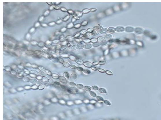
Цепочки конидий из спородохий пораженного плода нектарина

4. Методические рекомендации по выявлению и идентификации бурой монилиозной гнили Monilinia fructicola (Winter) Honey. МР ВНИИКР 73-2015