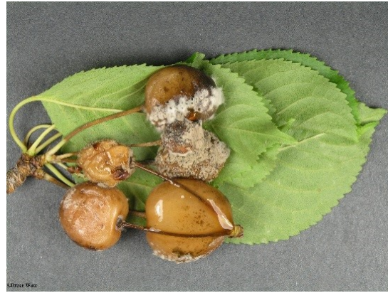
Спородохии Monilia fructicola ( http://umaine.edu/ipm/ipddl/publications/5090e/ )