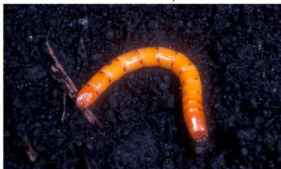
Личинка Melanotus communis Gyllenhal