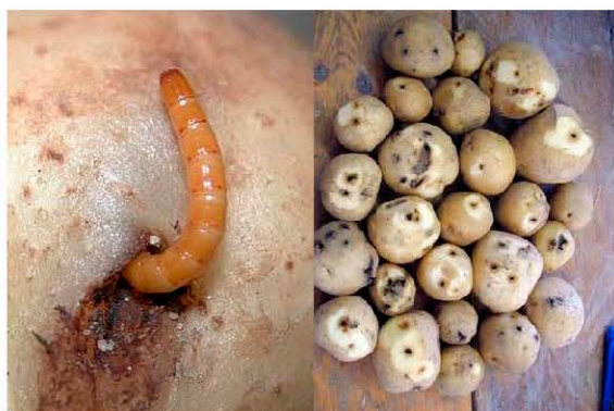
Картофель, поврежденный проволочником Melanotus communis ( https://pubs.ext.vt.edu/2812/2812-1026/2812-1026.html )

Методы диагностики: визуальный досмотр больных растений на выявление щелкунов и проволочников.