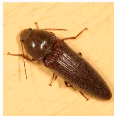
Имаго Melanotus communis ( https://pubs.ext.vt.edu/2812/2812-1026.html )