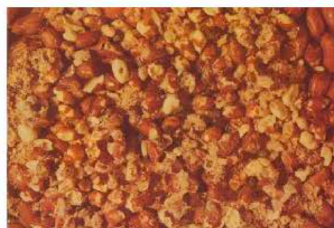
Арахис, поврежденный арахисовой зерновкой при хранении (Grossmann Irler, Manual of the Most Common Pest of Stored Products, Degesch GMBH, 1976)