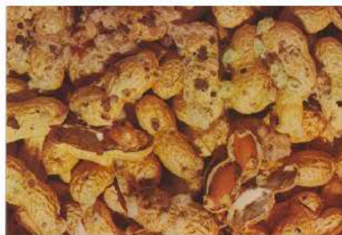
Повреждения арахиса арахисовой зерновкой (Grossmann Irler, Manual of the Most Common Pest of Stored Products, Degesch GMBH, 1976)