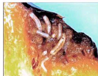
Личинки B. dorsalis в пораженном фрукте