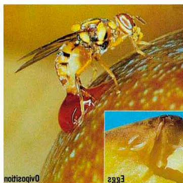
Самка B. dorsalis , откладывающая яйца под кожицу фрукта