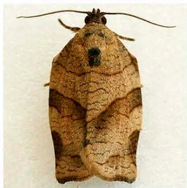
Choristoneura rosaceana

Гусеницы младшего возраста минируют листья. В старших возрастах оплетают паутиной листовую пластинку, скручивая ее трубку. Внешние симптомы: скручивание и увядание листьев, молодых побегов.