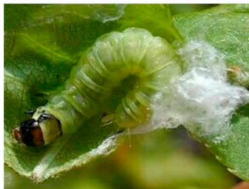
Choristoneura rosaceana